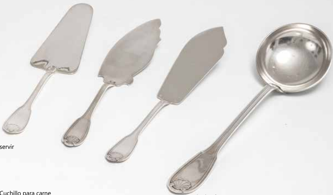
Cuchillo para carne