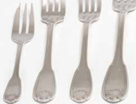
Tenedor para mariscos