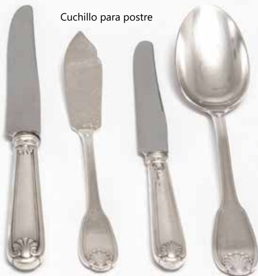
Cuchillo para postre