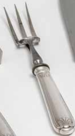
Tenedor y cuchillo de trinchar