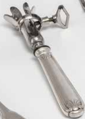
Sostenedor de hueso