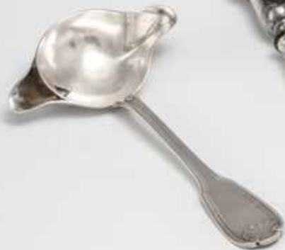
Cuchara de salsa