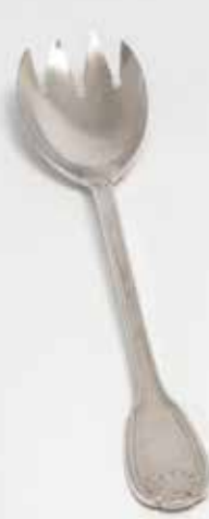
Tenedor y cuchara de ensalada