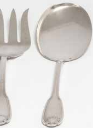
Horquilla de servir