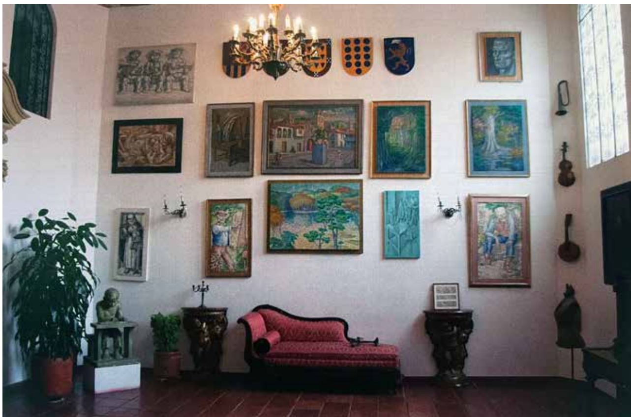
Casa familia Acuña González.

Carrizosa Posada, Diego Francisco. La cosmogonía chibcha en la obra de Luis Alberto Acuña / diego Francisco Carrizosa Posada; - Bogotá D.C.: Editorial Politécnico Gran Colombiano, 2018. Lotes 18 y 112 ilustrados en la página 55.